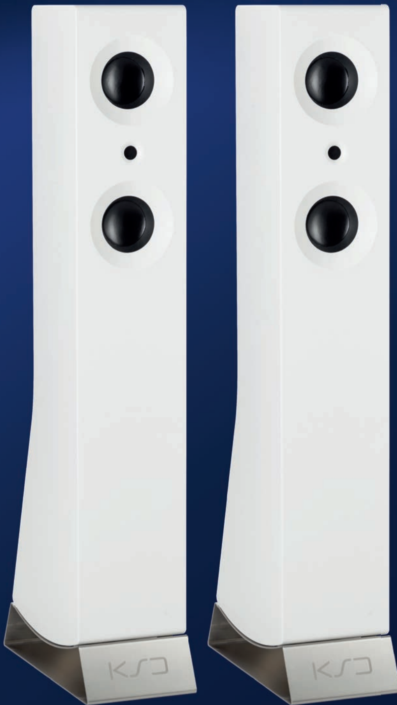
KSD 2030 | VESSEL | OLD PULTENEY